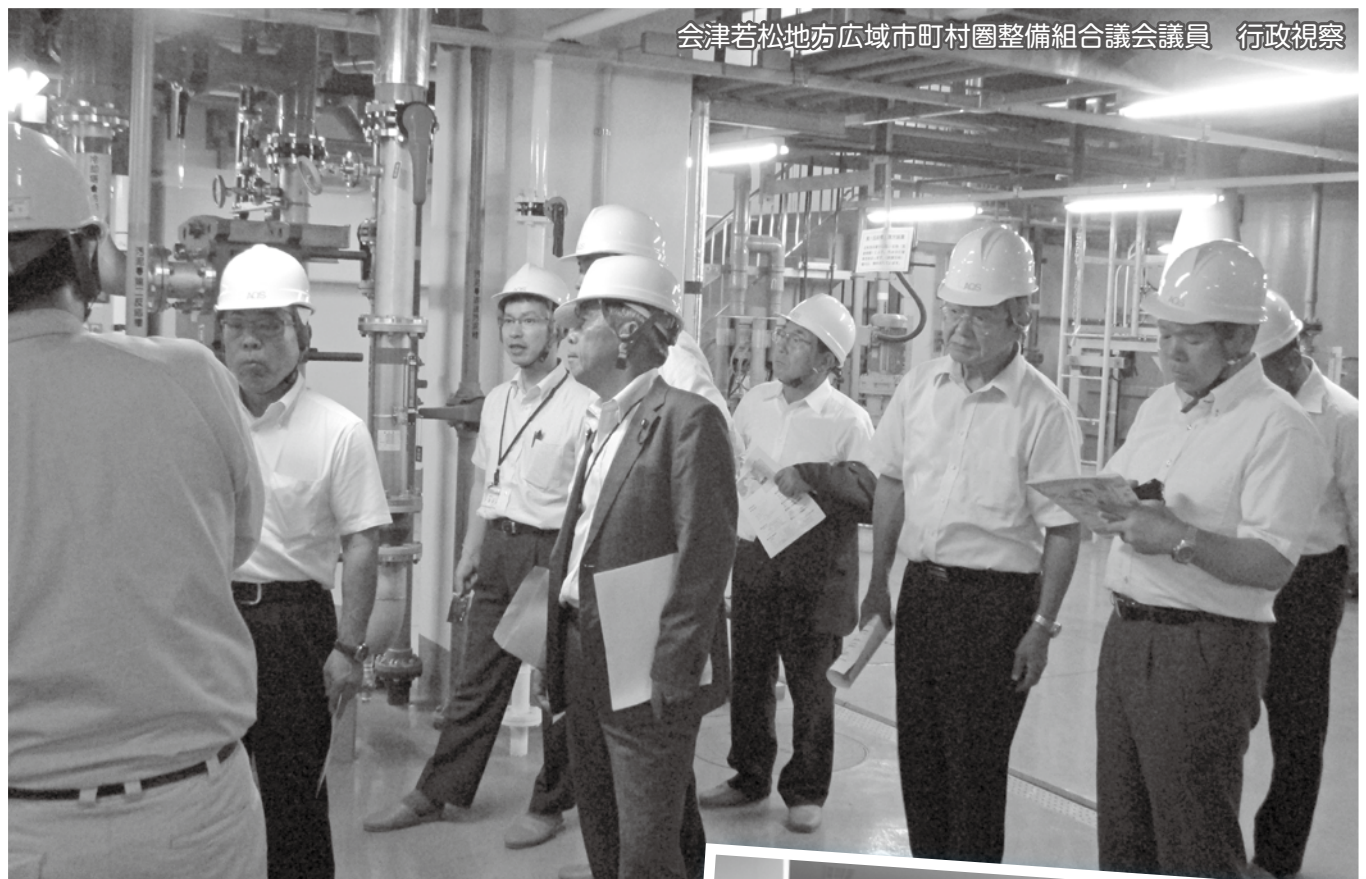
会津若松地方広域市町村圏整備組合議会議員 行政視察