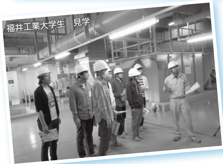
福井工業大学生 見学